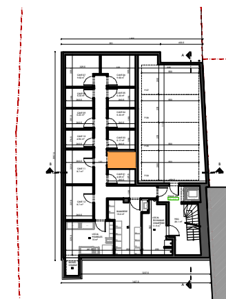
SOUS-SOL -02 (CAVES)