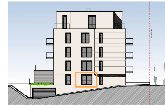
FACADE LATÉRALE GAUCHE