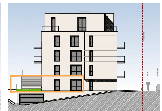
FACADE LATERALE GAUCHE